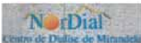
GINÁSTICA EM HEMODIÁLISE